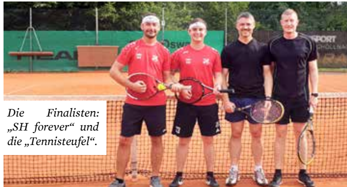
Die Finalisten: „SH forever“ und die „Tennisteufel“.