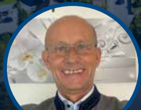
Thomas Habereder 2. Bürgermeister