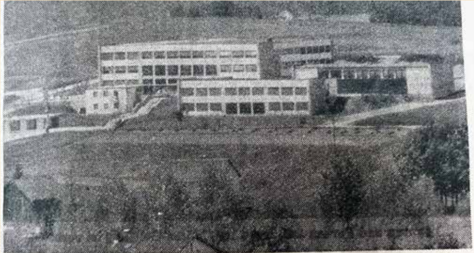
Der großzügig erbaute Schulkomplex auf der „Brunnleiten“ mit der Hauptschule (großes Gebäude), Sonderschule (kleines Gebäude im Hintergrund) und Turnhalle (rechts) ist schon wieder zu klein. Je eine Klasse der Hauptschule und der Sonderschule mußten in die Grundschule an der Bahnhofstraße ausquartiert werden. Der Omnibushaltestellenplatz (ganz links im Bild) ist völlig unzureichend, und die Turnhalle reicht nur für die Haupt- und Sonderschule. Die Grundschule muß mit einem kleinen Gymnastikraum im eigenen Haus vorliebnehmen.