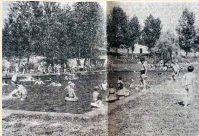
Das Freibad an der Englfinger Straße in Schöllnach (Bild) entspricht für die Zukunft nicht mehr den Erfordernissen. Deshalb sei die Anlage eines Freibades neben dem Realschulgebäude geplant worden, berichtete der Bürgermeister bei einer Versammlung. Wenn dazu 80 Prozent der Kosten zugeschossen werden, könne dieser Traum in einigen Jahren Erfüllung finden.

Einschließlich des Ehrensoldes für die Altbürgermeister habe die Marktgemeinde monatlich 28 Beamte, Angestellte oder Arbeiter zu entlohnen. Alle Monate seien von der Marktkasse rund 40.000 DM in Kleinbeträgen an die Sozialhilfeempfänger auszuzahlen. Zur schnellen Beförderung von Kranken in ein Kran-