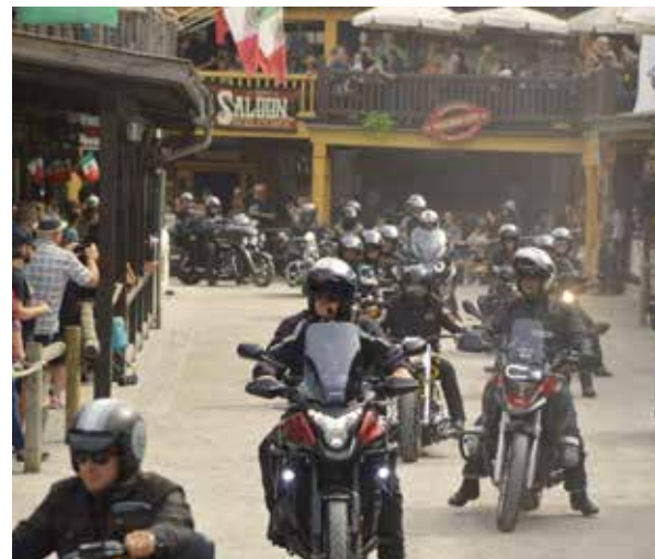
Bei der Durchfahrt durch Schöllnach. - Das Highlight des Benefizkorsos: Motorräder, Trikes und Quads fahren durch die Main Street von Pullman City.